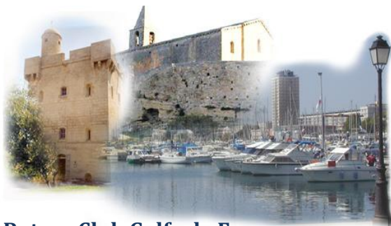
Rotary Club Golfe de Fos